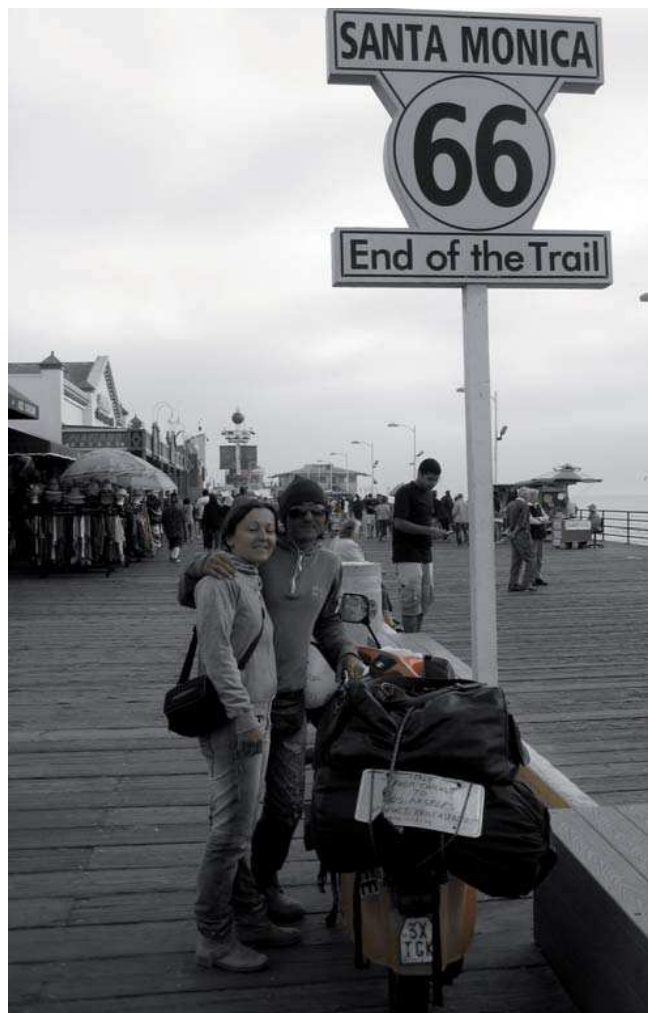
Santa Monica, California.