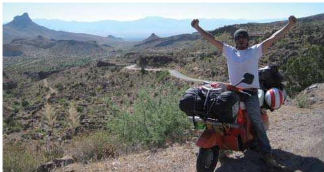
Mojave Desert, California.