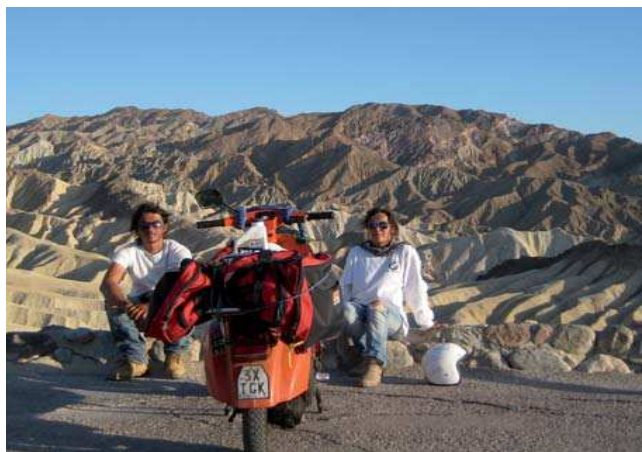
Zabriskie Point, Death Valley.

Vegas, Monument Valley e il Canyon de Chelly. In totale abbiamo percorso 7.000 km e 10 Stati".